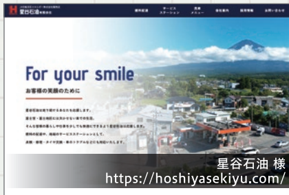
星谷石油 様 https://hoshiyasekiyu.com/

たくさんある取扱いサービスの内容が分かりやすいようにページ構成、レイアウトを行いました。シンプルですがデザイン性のあるWebフォントを使用し固くなりすぎないデザインにしています。