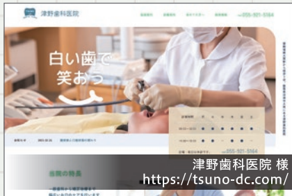
津野歯科医院 様 https://tsuno-dc.com/

沼津市大岡にある津野歯科医院様のWebサイトを新規に作成いたしました。ファーストビューに必要な情報を盛り込むことで、利便性の向上を図り、「歯医者は怖い」というイメージ払拭のための柔らかい色使いを心掛けています。