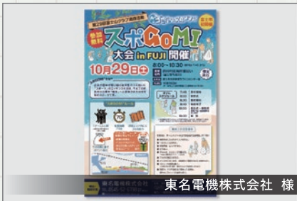
東名電機株式会社 様

最近、各地で行われている「ごみ拾い活動」に「スポーツ」のエッセンスを加えて行われる「スポGOMI」富士大会のチラシをデザインさせていただきました。青色をベースに爽やかなイメージ仕上げました。