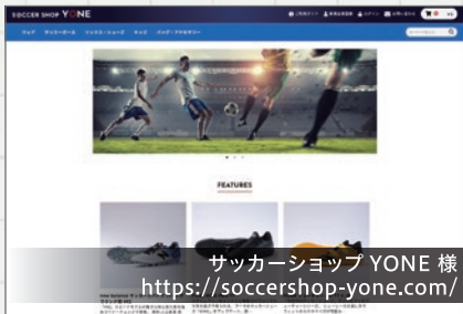
サッカーショップ YONE 様 https://soccershop-yone.com/

富士宮市にあるサッカー用品に特化したショップのECサイト化を行いました。ブルーを基調としたシンプルなデザインとし、パッケージ化されたショップ構築サービスとの差別化も考慮し、機能的にも商品ページへの誘導を最大化するようなカスタマイズを行っています。