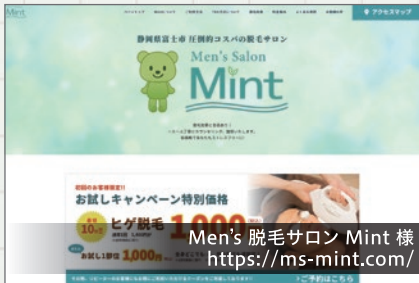
Men's 脱毛サロン Mint 様 https://ms-mint.com/

メンズサロン・ミント様のWebサイトをリニューアルしました。ポップな印象で、利用方法や料金、施術内容などが、よりわかりやすく案内できるようデザインと構成を再構築しました。