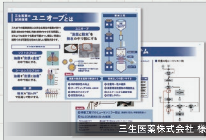
三生医薬株式会社 様

三生医薬様のユニオープ解説パネルを制作させていただきました。お客様が原稿をしっかりとご用意くださいましたので、ブラッシュアップできるよう心がけてデザインしました。