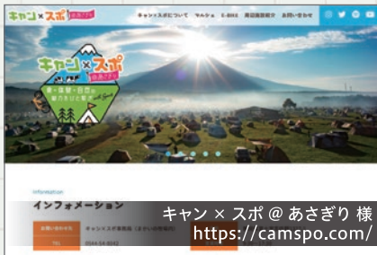
キャン × スポ @ あさぎり 様 https://campsyo.com/

朝霧エリアの周辺施設やEバイクのコースを紹介するWebサイトを制作しました。写真を多く使用し、楽しさや観光地の魅力が伝わるようにデザインしました。また、パンフレットにも使用するイラストを使い統一性を持たせています。