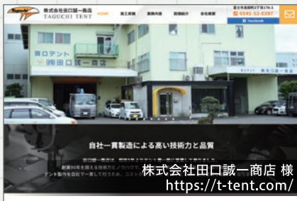
株式会社田口誠一商店 様 https://t-tent.com/

様々なテントを制作されているお客様なので、そのイメージが伝わるよう、写真を多く取り入れたデザインにさせていただきました。