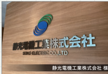
静岡電機工業株式会社 様

今静岡電機工業株式会社様の入口ロビーの壁の装飾を担当させていただきました。会社の顔になる所ですので、細かいところまで調整させていただきました。