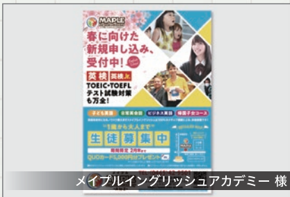
メイプルイングリッシュアカデミー 様

小田原にあるメイプルイングリッシュアカデミー様のチラシをデザインさせていただきました。教室の明るいイメージが伝わるデザインにさせていただきました。