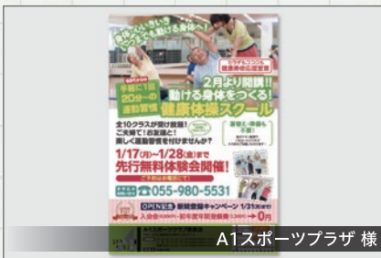
A1スポーツプラザ 様

A1スポーツプラザ様のシニア向けスクールチラシのデザインをさせていただきました。シニアが気軽に利用できる簡単レッスンです。気になる方はWEBを見てみてください。