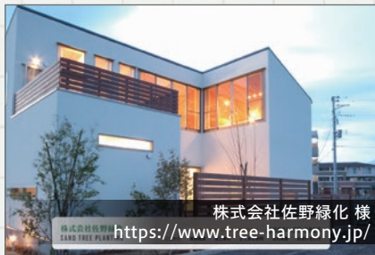
株式会社佐野緑化様 https://www.tree-harmony.jp/

グリーンをベースに、写真を大きく使用したデザインで業務内容の伝わりやすさを意識して制作しました。 施工事例はお客様にて更新できるよう Wordpressのシステムを使用しています。