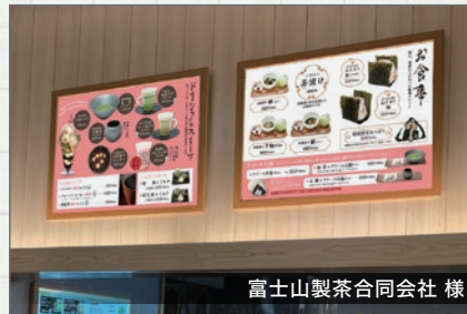
富士山製茶合同会社様

コリドー富士店、「HARE時々OCHA」のメニューサインを制作させていただきました。冬メニューになるので温かみのある色合いに仕上げています。