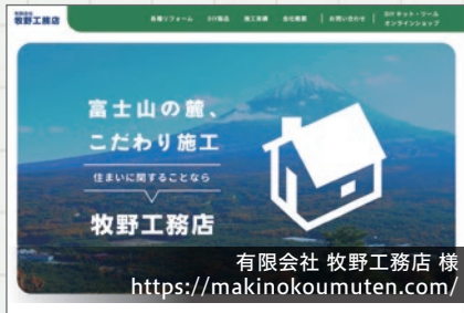
有限会社 牧野工務店様 https://makinokoumuten.com/

牧野工務店様のwebサイトのリニューアルを行わせていただきました。地域密着の工務店という親近感の醸成や、施工に対するこだわりが伝わるように制作いたしました。オンラインショップも併設しています。