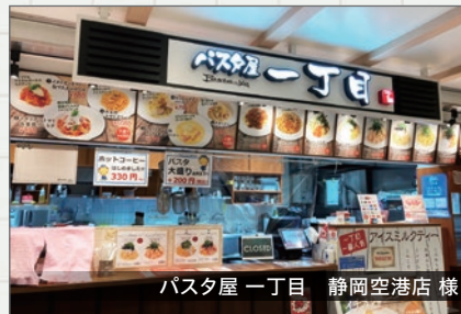
パスタ屋 一丁目 静岡空港店様

静岡空港内のパスタ屋一丁目様のリニューアルデザインをさせていただきました。パスタが美味しく感じられるように明るくイタリアンイメージで制作させていただきました。