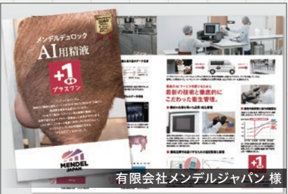
有限会社メンデルジャパン様

豚の精液を研究・販売するメンデルジャパン様の会社案内を制作させていただきました。ヒアリングを重ね先端技術を伝えられるようデザインしました。