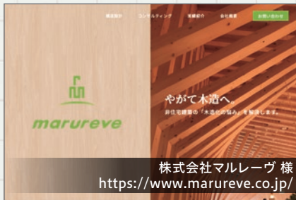
株式会社マラーヴ様

サイト全体を通して木のぬくもりやさしさが伝わるよう、色使いや写真の見せ方を工夫いたしました。実績もページ遷移せずに詳細が見れるようシームレスなコンテンツ表示としています。